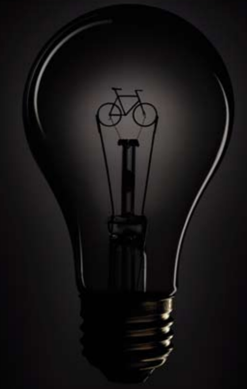
© 1989 Panda Symbol WWF - World Wide Fund For Nature (Germany World Wildlife Fund) © WWF & "ing Planet" et WWF Registered Trademarks / WWF & "For One Planet, with a" sont des marques déposées