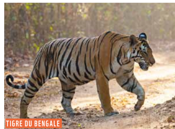
TIGRE DU BENGALE

Le pays sera le premier à atteindre l'objectif fixé par le Programme mondial de restauration des populations de tigres à l'état sauvage.