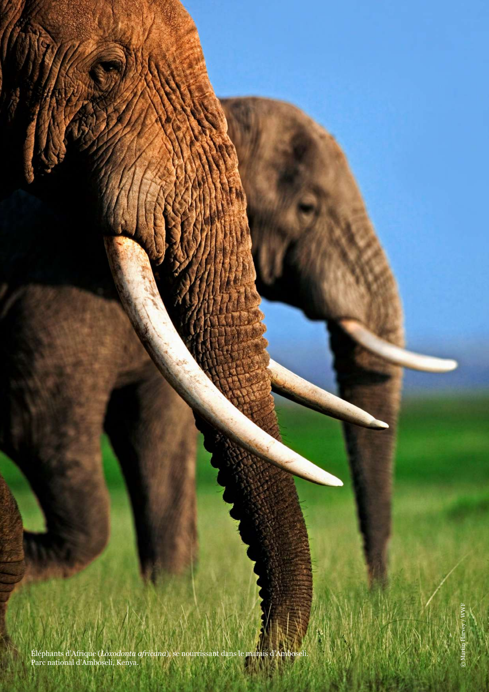
Éléphants d'Afrique ( Loxodonta africana ), se nourrissant dans le marais d'Amboseli. Parc national d'Amboseli, Kenya.