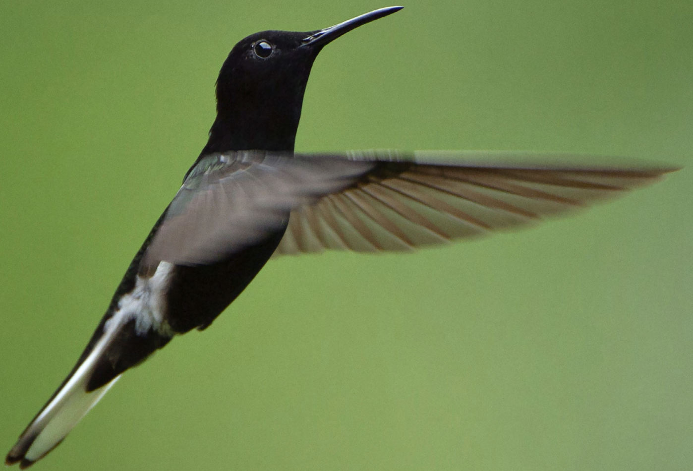
Colibri demi-deuil ( Florisuga fusca ), Forêt atlantique, Réserve écologique de Guapiaçu (REGUA), Brésil.