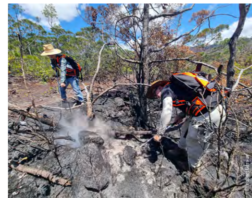
Des bénévoles WWF formés à la lutte incendie éteignant des foyers résiduels lors d'un feu de forêt dans le sud de la Nouvelle-Calédonie

Ces premières interventions ont été saluées par les pompiers et ont démontré l'intérêt de l'appui des associations dans la lutte contre les feux de forêt. L'objectif du WWF en Nouvelle-Calédonie est de continuer à déployer ce réseau pour permettre une large surveillance des massifs forestiers pour les préserver de la menace incendie. ■