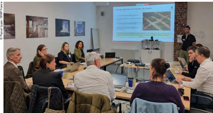
Atelier du Forum "Forêt, bois : innovations et solutions" réunissant les partenaires du WWF France

Sylvamo et Michelin ont pu partager leurs avancées dans leur mise en conformité, mais également les difficultés d'exécution de la traçabilité nécessaire à la fois dans le cas d'exploitations en France et en Indonésie. Les riches échanges autour des bonnes pratiques et des opportunités en matière d'application d'une traçabilité à la parcelle, et ses limites, montrent tout l'intérêt d'échanges entre ONG et entreprises. Le rendez-vous est déjà donné au premier semestre 2026 pour un nouvel atelier, cette fois sur le terrain. ■