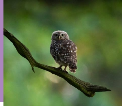
La Chouette Chevêche