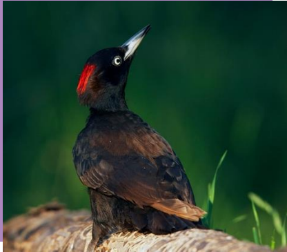
Le Pic Noir