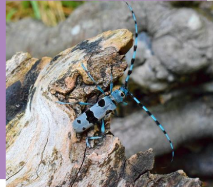
La Rosalie des Alpes